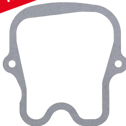
Nuova 638.901 – MAN 51.03905.0134 Materiale: EWP 407 grigio (materiale morbido)

ElringKlinger AG | Divisione commerciale ricambi