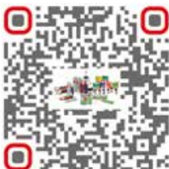
Онлайн каталог за уплътнителни вещества