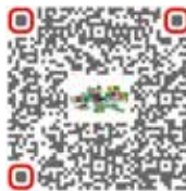
Consultor de massas vedantes