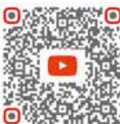
Vídeos de montagem sobre massas vedantes

Linha direta de assistência Elring SAC 0800 774 7464 sac@elringklinger.com www.elring.pt