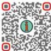
Informações de assistência