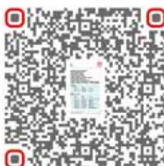
Informação de assistência