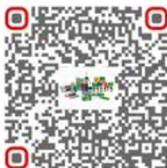
Consultor de massas vedantes