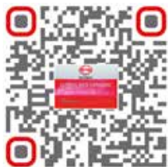
Catalogue en ligne