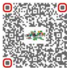
Conseiller en pâtes à joint